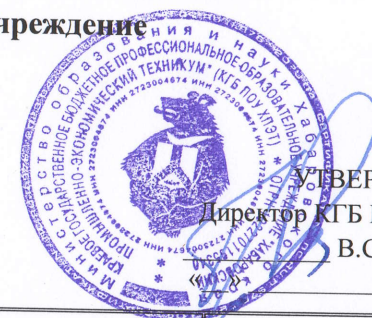
ГРАФИК учебного процесса заочного отделения на 2024 – 2025 учебный год

УТВЕРЖДАЮ Директор КГБ ПОУ ХПЭТ В.С.Приходько 2024 г.